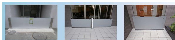
ビル・マンション 出入口