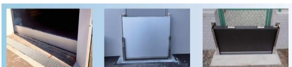
工場・倉庫 出入口

https://www.youtube.com/watch?v=vlfllnk9zfg